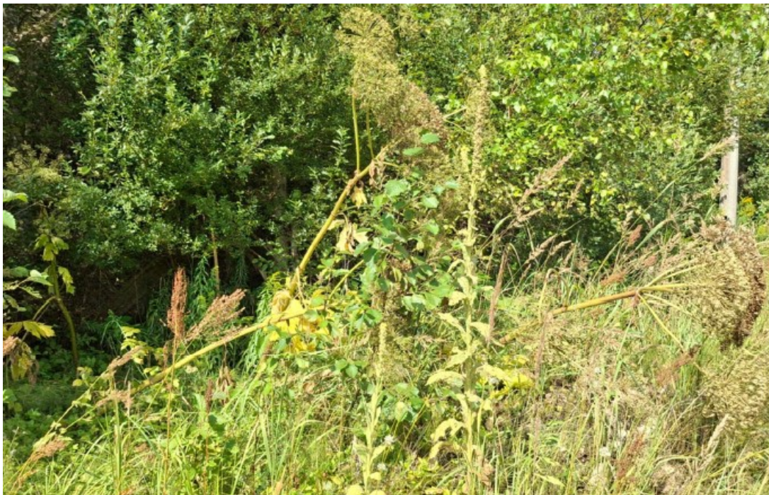
Foto 1. Karuputk Kulbilohu tn 5 kinnistul (autor: Hendri Seinberg, august 2025)

Planeeringuga kavandatu elluviimisel tuleb täpsustada karuputke kasvukoha ulatus ning vajadusel anda liigiline määralus. Tuleb vältida võõrliigi levitamist (koloonia mulla teisaldamist uutesse kohtadesse, tehnikaga läbi kolooniate sõitmist jmt). Karuputk tuleb hävitada (väljakaevamine ja herbitsiidiga mürgitamine).